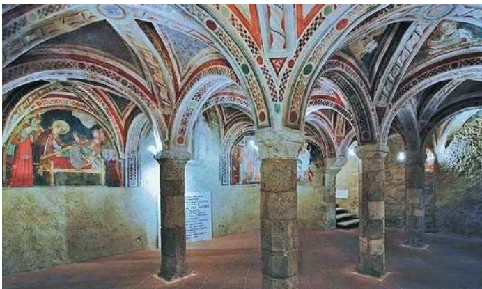
CRIPTA CATTEDRALE SANTA MARIA IN PLATEA