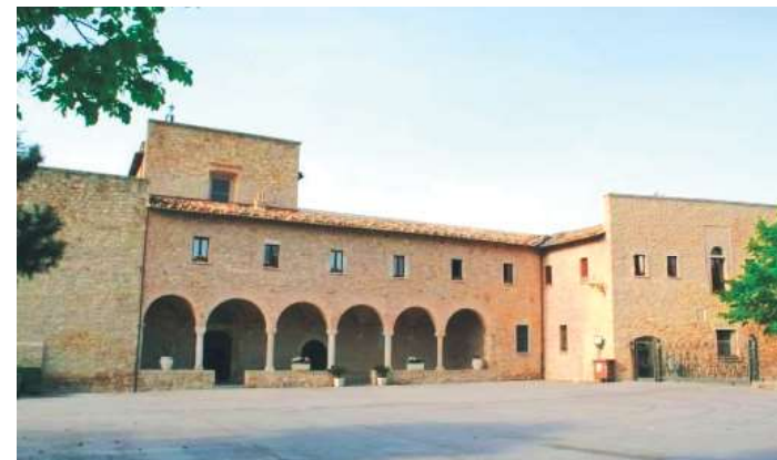
SANTUARIO SANTA MARIA DEI LUMI